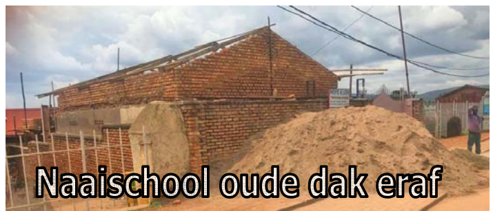
Naaischool oude dak eraf